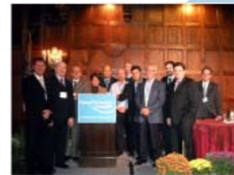
Financial Technology Insight