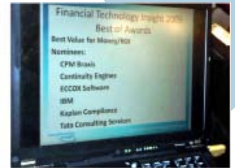
Financial Technology Insight: solução com excelente ROI