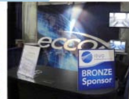
Patrocínio IDUG 2010 - Flórida