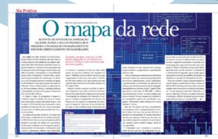
Information Week Ed 209