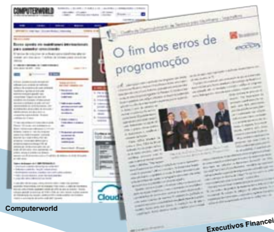
Computerworld Executivos Financeiros