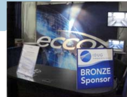
Patrocínio IDUG 2010 - Flórida