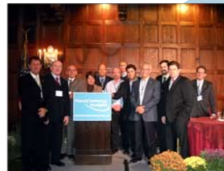
Financial Technology Insight