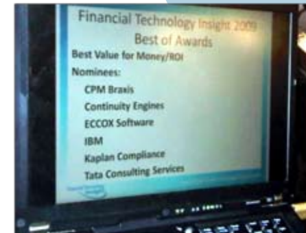
Financial Technology Insight: solução com excelente ROI

Headquarter Al. Rio Negro, 433 - 4º andar - Ed.1 06454-904 - São Paulo - Brazil Phone +55 11 4133-1969 brazil@eccox.com www.eccox.com.br